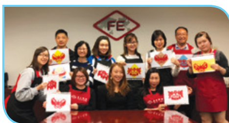
參與剪紙工作坊的員工展示他們的作品

本集團在四月舉辦了中國傳統剪紙藝術工作坊，邀請國家一級工藝美術師李雲俠老師的得意門生擔任工作坊導師，提升員工的中國文化素養和生活品味。