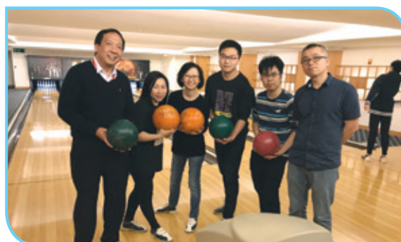
員工康樂日中的保齡球活動