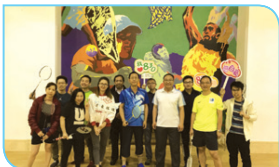
員工投入康樂日羽毛球活動，鍛鍊健康體魄