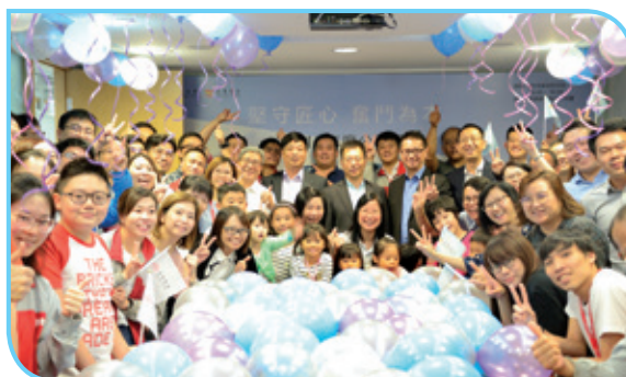
香港總部辦公室全體員工參與公司日，增強團隊凝聚力