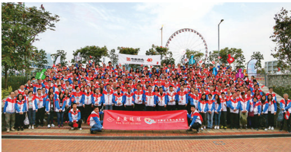
二零一九年一月參與公益金五十週年百萬行