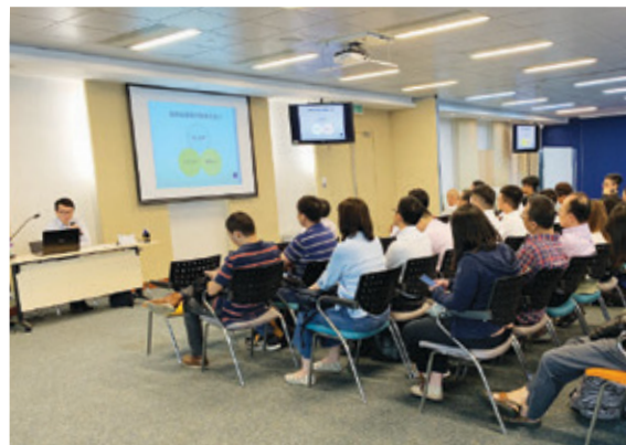
廉政公署建築業防貪講座

本集團全體致力進行廉潔建設，絕不容忍任何貪污及舞弊。不論與客戶或供應商合作時，不得提供、索取或收受任何利益。如員工察覺任何違反守則的情況，可以透過舉報電話、電子信箱和郵寄進行舉報。除了遵守相關法例外，員工手冊第七章提亦有提及《防止賄賂條例》，並詳細描述有關公司政策，為員工在收受禮物、接受款待等利益衝突情況時的處理手法作出清晰指引。集團亦有針對反貪污議題，向董事及員工提供了多項內部培訓，包括廉政公署建築業防貪講座、「守望初心使命，保持清廉本色」講座、「堅守底線、清正廉潔」講座等。