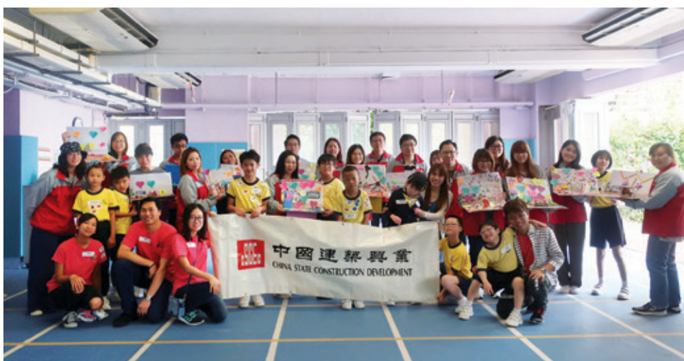
二零一九年十月二十六日與「親切」合辦的「共融藝術家」愛心工作坊

集團今年參與了中海集團舉辦的義工派粽大行動，為社區帶來一份溫暖。同時每年公司全體都會參與「公益百萬行」活動，鼓勵員工身體力行實踐公益。