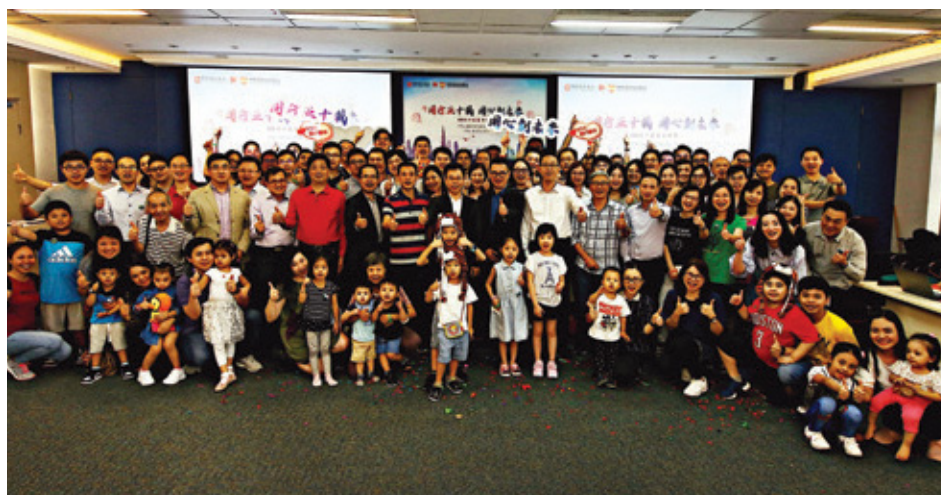
每年約在八月三十日舉辦的公司日，與全體員工同樂

本集團從員工發展及關懷到企業文化，始終堅持履行企業社會責任，營造健康和諧的工作氛圍和積極陽光的企業形像，集團會定期舉辦員工活動以及節日慶祝活動，加強團隊精神及舒緩工作壓力，活動包括員工康樂日、「公司日」活動、公益金百萬行等。